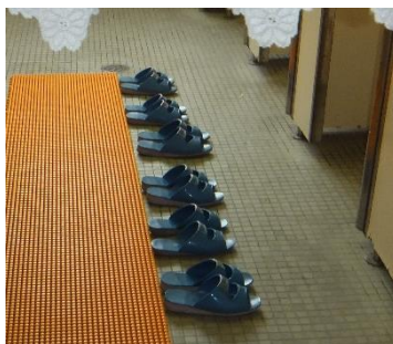
今年度もスリッパ整頓