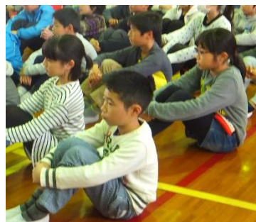
規律ある学校生活