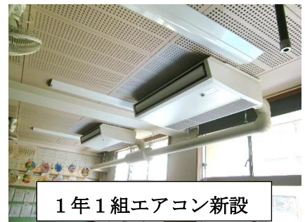
1年1組エアコン新設